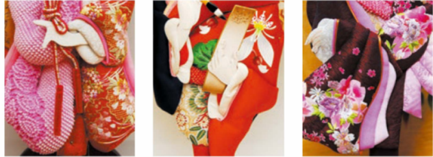
金彩刺繍鹿の子絞 川俣正絹手描き時絵 友禅牡丹刺繍