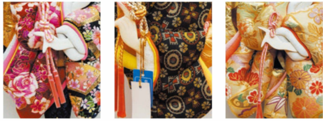
友禅金彩刺繍 龍村美術織物 正絹帯地